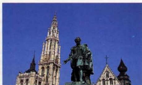
De kathedraal van Antwerpen op de Grote Markt.

Antwerpen heette in de 16de eeuw 'De triomfelycke coopstad', een van de vele lovende benamingen die haar werden toegedicht. Dat Antwerpen nog steeds aanspraak kan maken op deze titel dankt zij aan de talloze winkels die haar maken tot wat zij is.