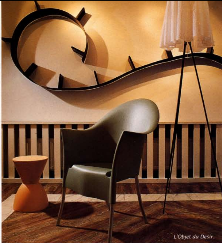
L'Objet du Desir.