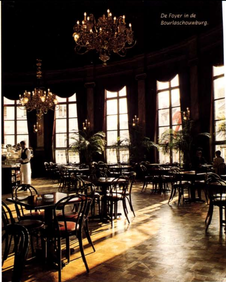
De Foyer in de Bourlaschouwburg.

In de Bourlaschouwburg (geopend in 1827), het centrum van het Quartier Latin, bevindt zich op de eerste verdieping brasserie 'De Foyer', een etablissement met een - hoe kan het ook anders - theateraal interieur. De Foyer is vanouds dé ontmoetingsplaats van de beaumonde. Op zondag, wanneer om de hoek de beroemde Vogelmarkt wordt gehouden, kan men hier terecht voor een uitgebreid brunchbuffet. Komedieplaats 18, Antwerpen, 03-2335517