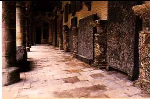
Binnenplaats in het centrum van Brugge.