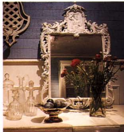
Kasimirs Antique Studio.