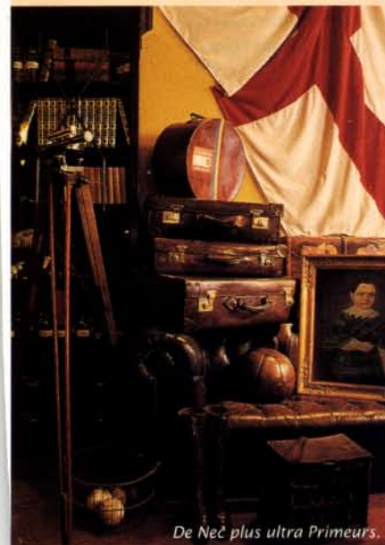
De Nec plus ultra Primeurs.

De nec plus ul'tra Primeurs Een vruchten- en groentenspecialist met een bijzondere collectie azijn en olijfolie. Korte Gasthuisstraat 5, Antwerpen, 03-2333439