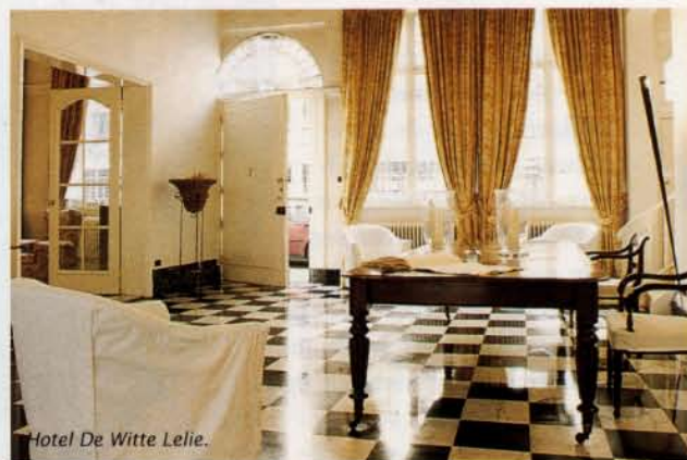
Hotel De Witte Lelie.

Keizerstraat 16-18, Antwerpen, 03-2261966