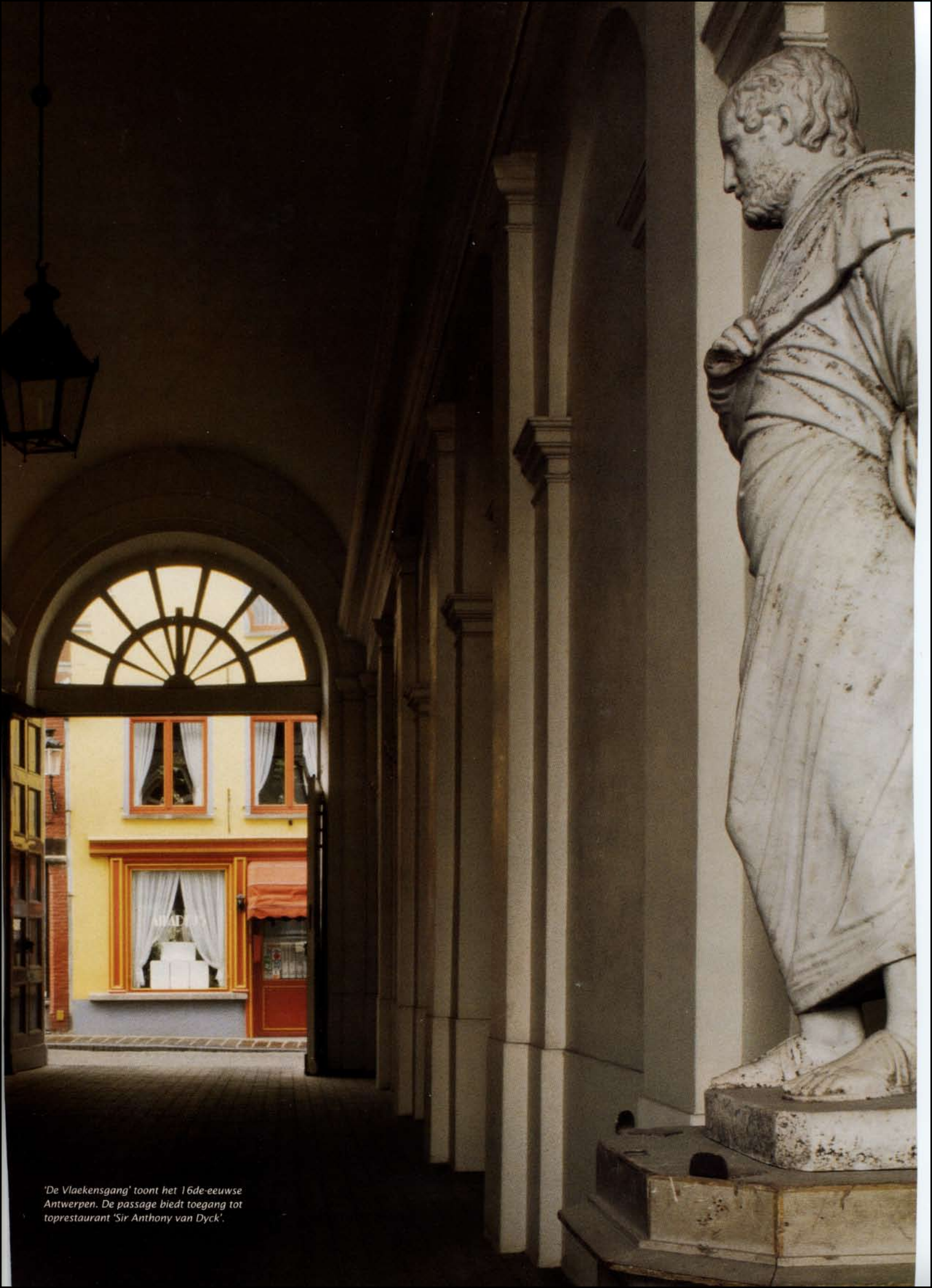
'De Vlaekengang' toont het 16de-eeuwse Antwerpen. De passage biedt toegang tot toprestaurant 'Sir Anthony van Dyck'.