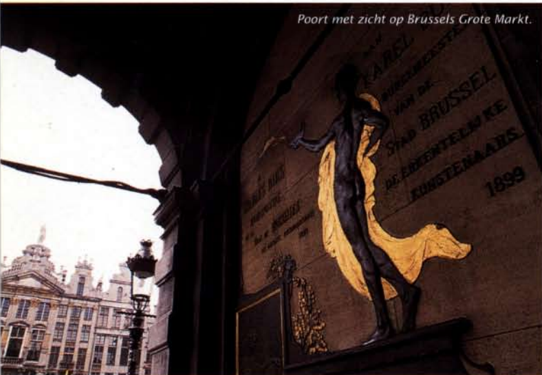
Poort met zicht op Brussels Grote Markt.