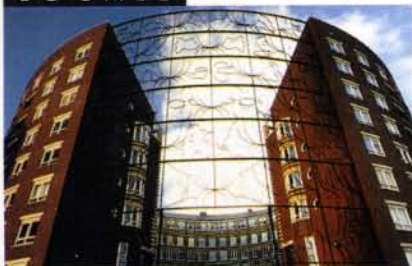
Barcelona-plein op het KNSM-eiland