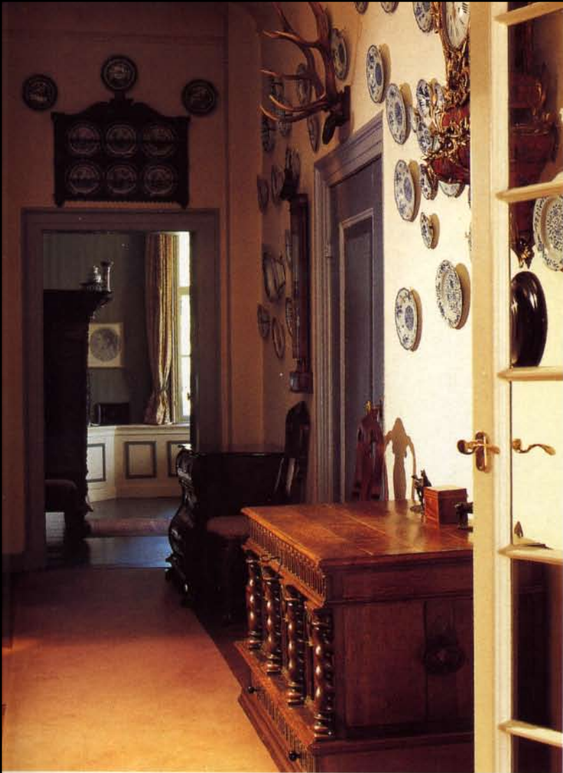
Sandenburg ademt de sfeer van vroeger tijden. Veel uit het verleden is bewaard gebleven; het huis is dan ook al sinds 1792 in de familie.

ten bruggetje over de slotgracht leidt de bewoner naar zijn voordeur. Onder de brug ligt een klein oranje bootje, ooit bedoeld om ermee vanuit de gracht de ramen aan de waterkant te lappen. 'Ik vind het heerlijk om hier te wonen maar het is ook belangrijk om je een tijd met andere dingen bezig te houden. De wereld is groter dan Sandenburg.'